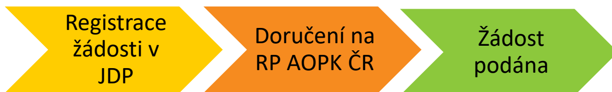
Obr. 1 – Kroky vedoucí k podání žádosti

Žadatel po registraci žádosti vygeneruje její tiskovou verzi ve formátu pdf a podepíše, čímž stvrdí čestná prohlášení a všechny skutečnosti uvedené v žádosti o dotaci. Ve lhůtě maximálně 5 pracovních dnů od registrace žádosti v JDP podepsanou tiskovou verzi žádosti (včetně všech příloh požadovaných dle kap. B.3 a příloh č. 3 a 4 této Příručky, které žadatel nevložil do JDP) doručí na AOPK ČR. Pokud je vytištěná žádost doručena osobně anebo poštou, bude žadatelem podepsána fyzicky. Žádost lze doručit i datovou schránkou (dále jen „DS“). V případě doručení žádosti e-mailem bude žádost podepsána kvalifikovaným elektronickým podpisem. Žádost je považována za podanou v momentě doručení na AOPK ČR.