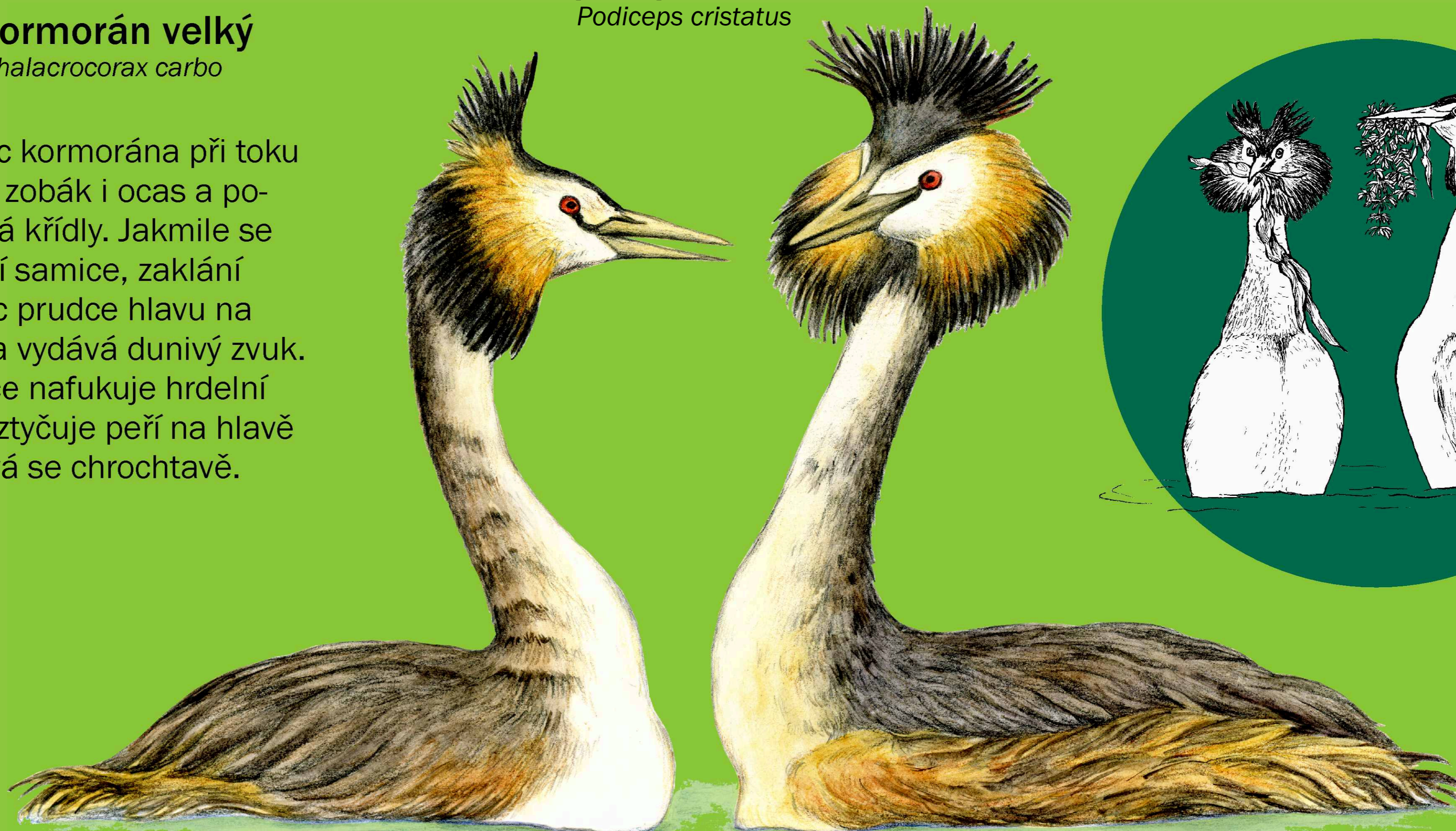
potápka roháč Podiceps cristatus

Samec kormorána při toku zvedá zobák i ocas a pocukává křídly. Jakmile se přiblíží samice, zaklání samec prudce hlavu na záda a vydává dunivý zvuk. Samice nafukuje hrdelní vak, vztyčuje peří na hlavě a ozývá se chrochtavě.