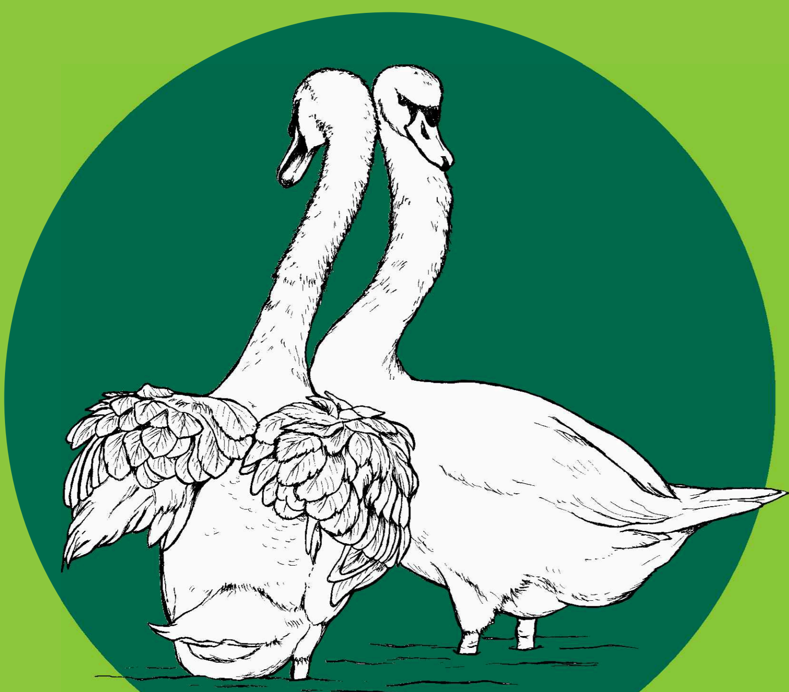
labuť velká Cygnus olor

Potápky k sobě připlouvají a vztyčují krky. Často při svatebním tanci drží v zobáčích stébla vodních rostlin.