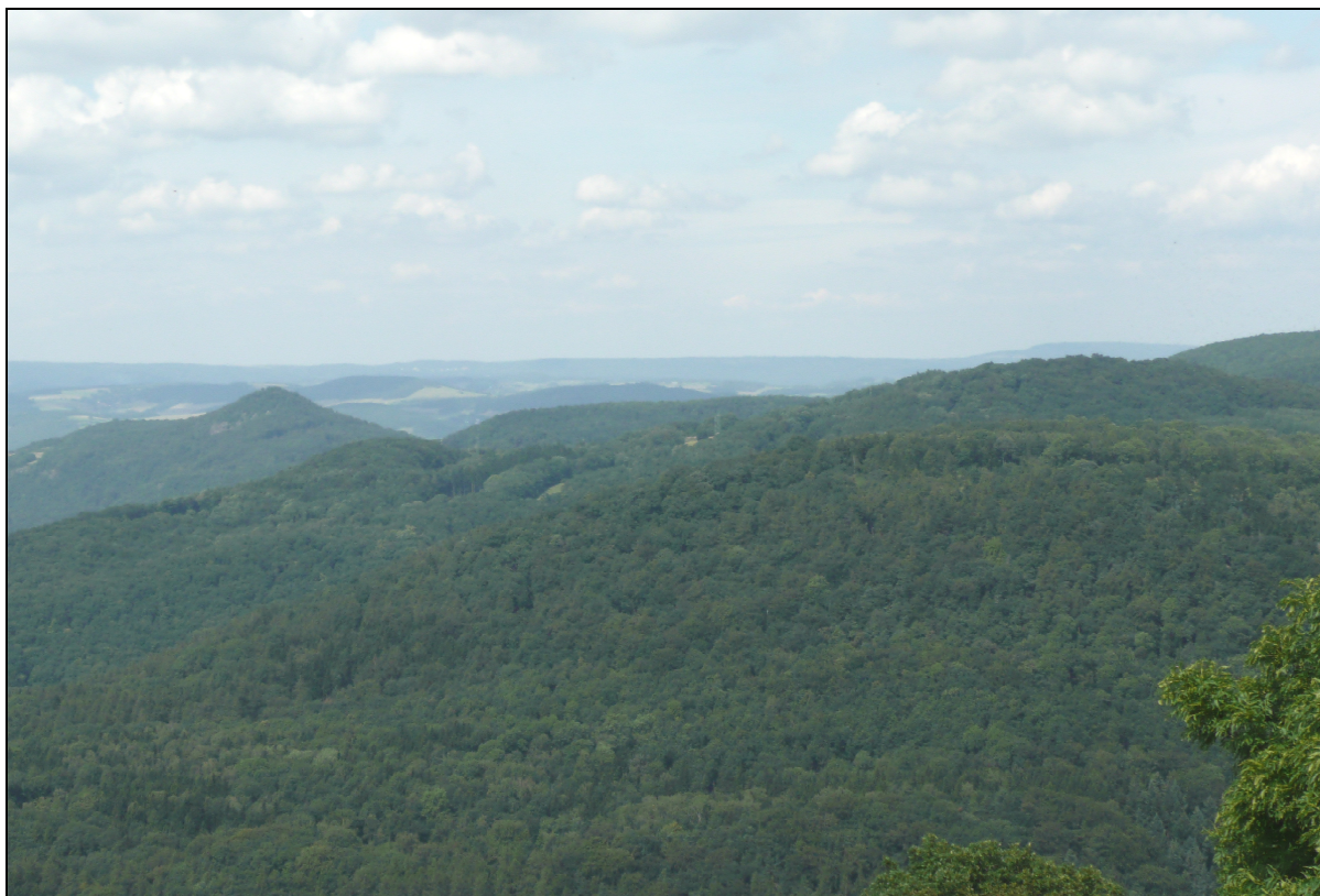
Lesní krajina sopečných pohorí.