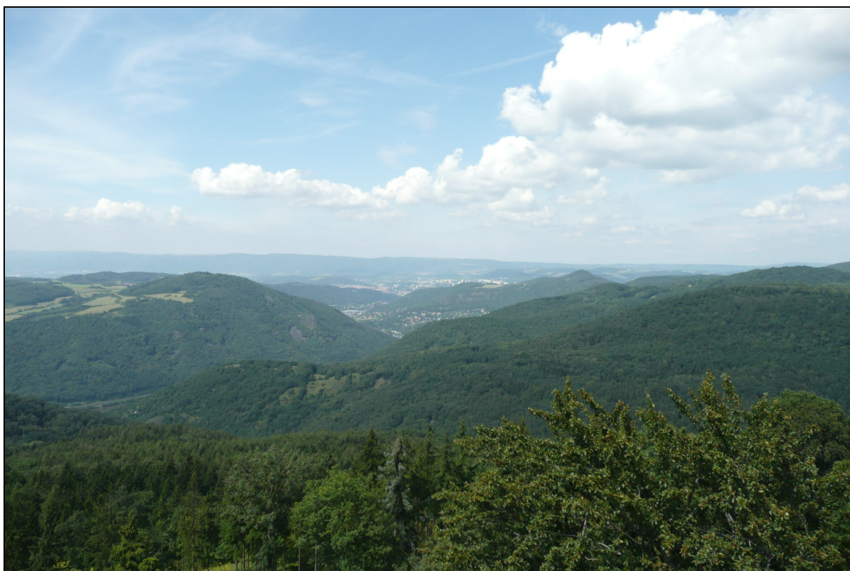
Lesní krajiny zaříznutých údolí, v dále urbanizované krajiny zaříznutých údolí.