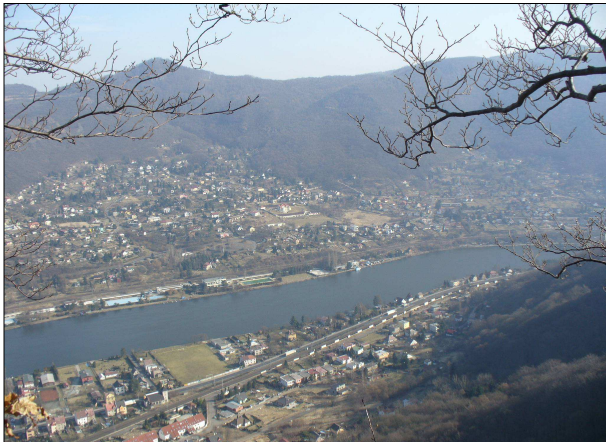
Urbanizovaná krajina zaříznutých údolí