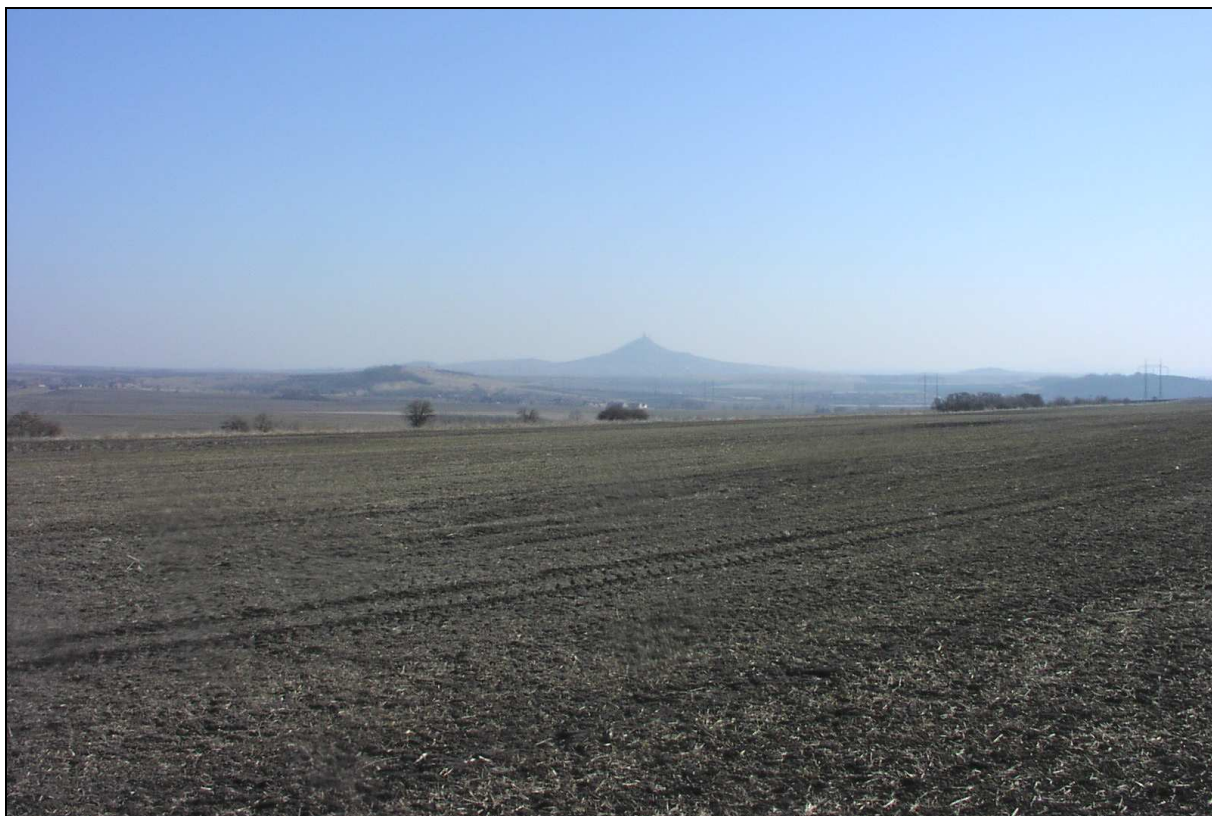
Starosídlní zemědělská krajina plošin a plochých pahorkatin