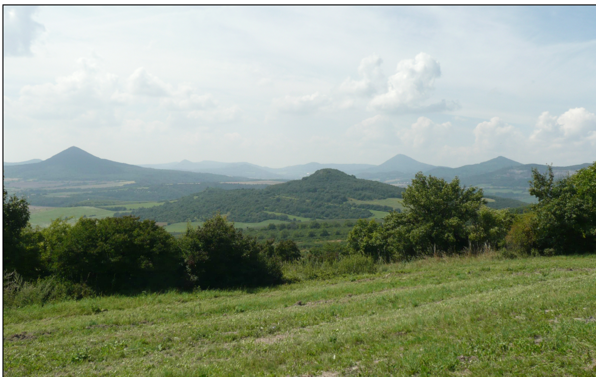
Lesozemědělská krajina kup a kuželů