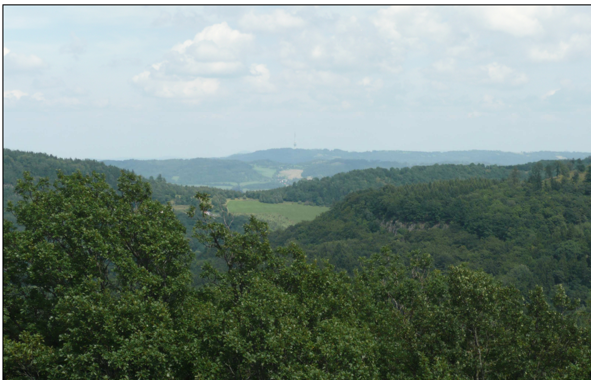
Lesní a v pozadí lesozemědělská krajina sopečných pohoří.