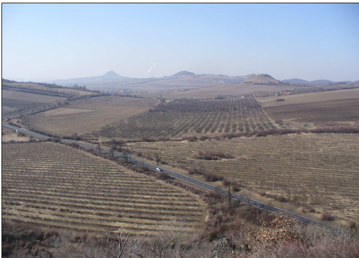
Zemědělská krajina kup a kuželů