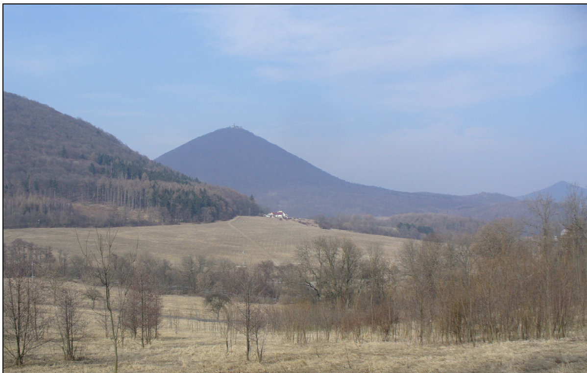
V pozadí lesní krajina kup a kuželů