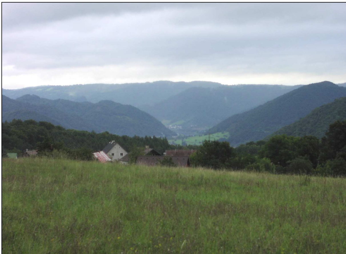
V pozadí lesní krajina zaříznutých údolí