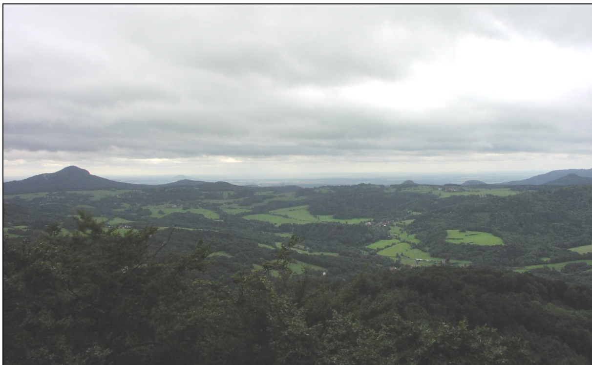
Středověká lesozemědělská krajina sopečných pohoří