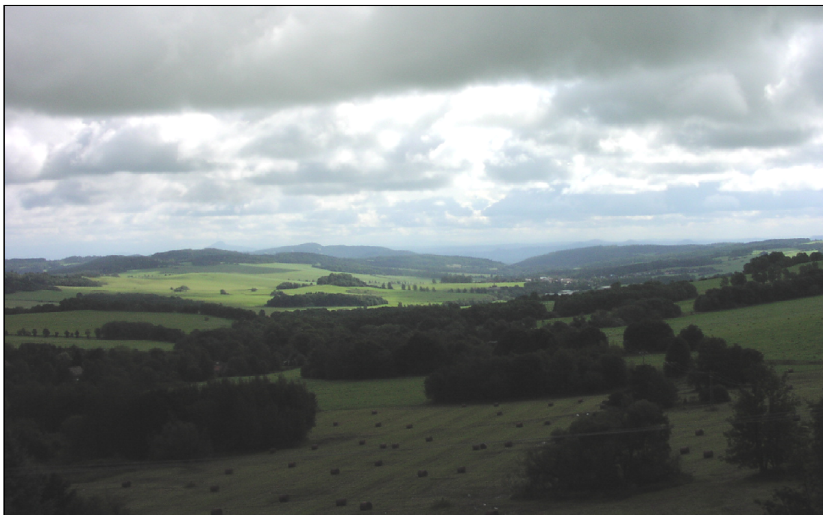
Středověká lesozemědělská krajina běžného reliéfu