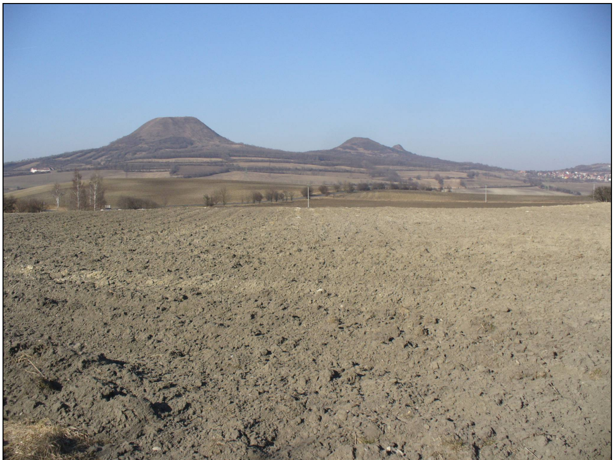
Zemědělská krajina kup a kuželů