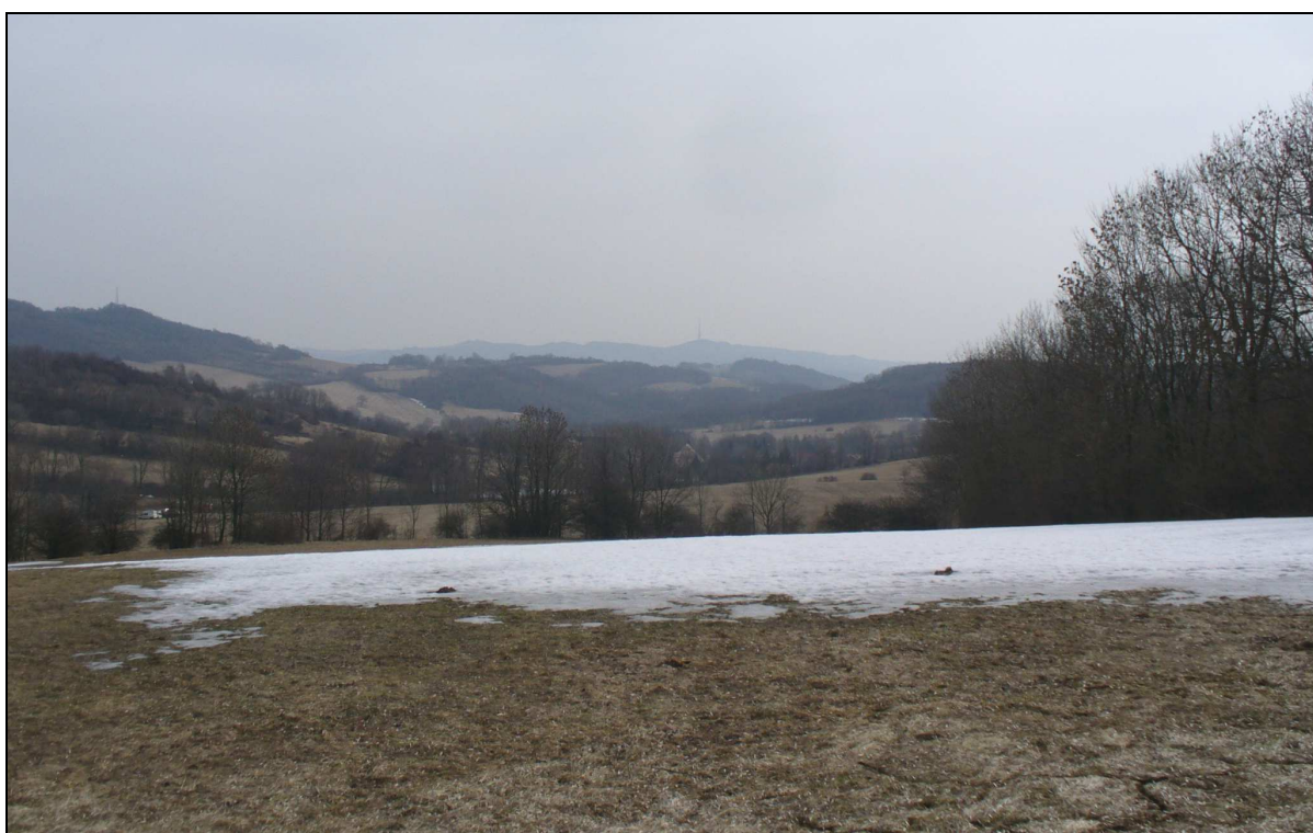
Středověká lesozemědělská krajina sopečných pohoří