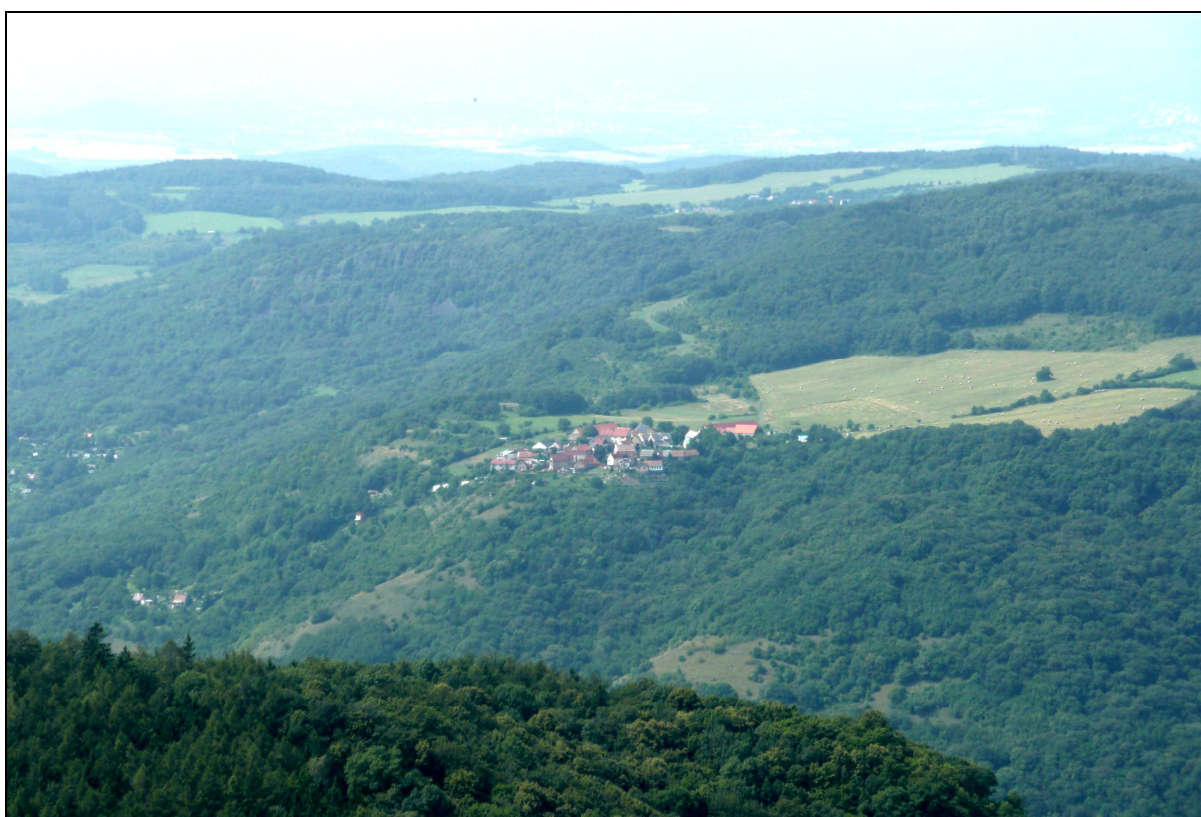
Sídlo ležící na rozhraní lesní krajiny zaříznutých údolí a lesozemědělské krajiny členitých pahorkatin a vrchovin