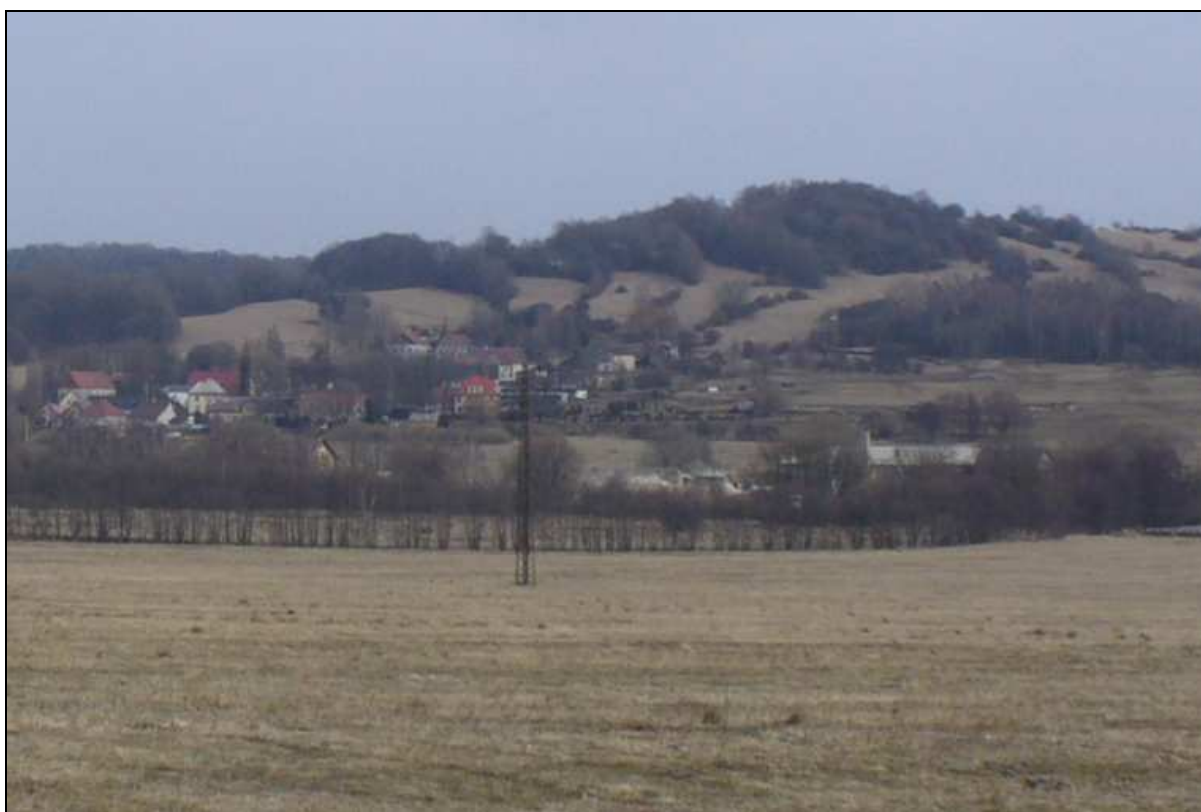
Pozdně středověká lesozemědělská krajina členitých pahorkatin a vrchovin Hercynika s okrouhlicí a navazující praprscitou plužinou