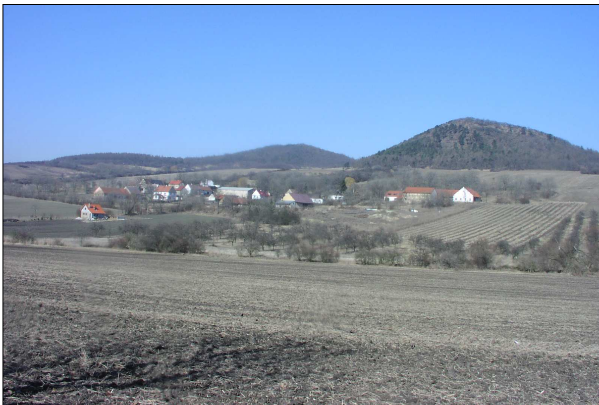
Lesozemědělská krajina kup a kuželů