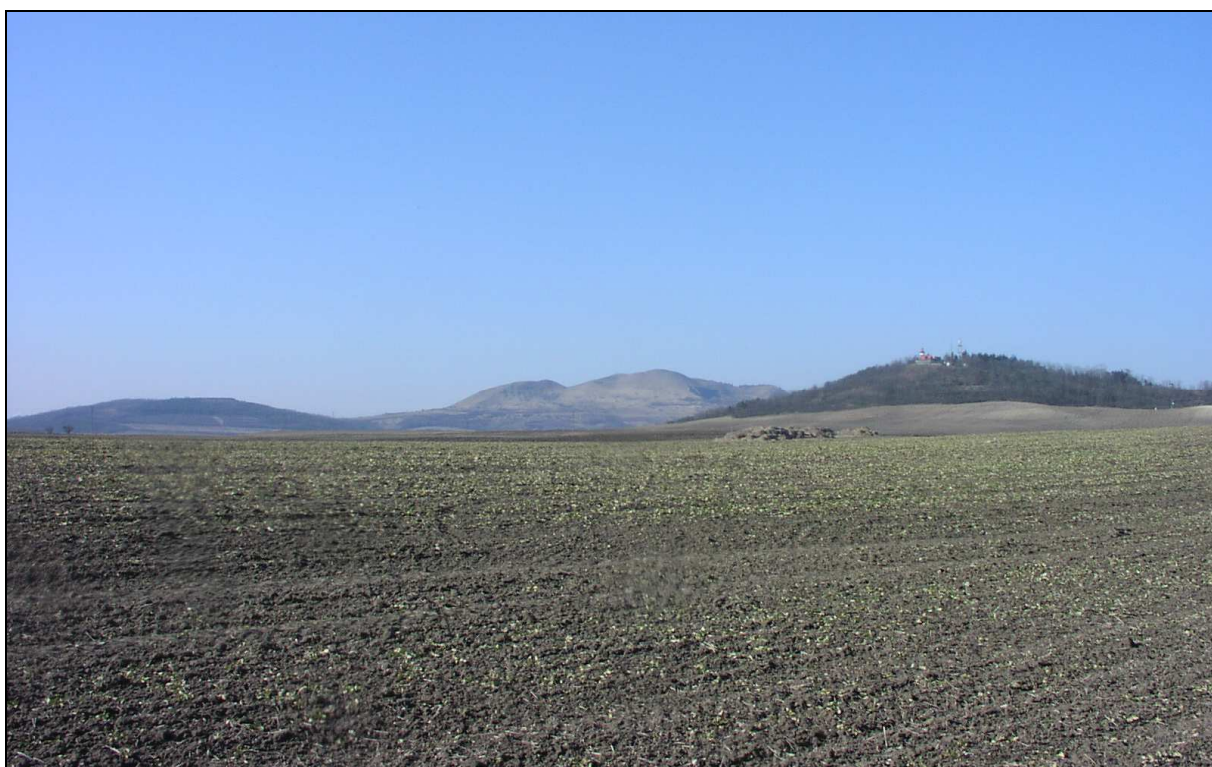
V popředí zemědělská krajina rovin, v pozadí zemědělská (vlevo) a lesozemědělská (vpravo) krajina kup a kuželů